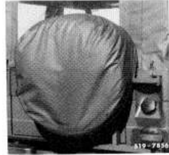
Abdeckhaube über Tarnnetz und Reserverad