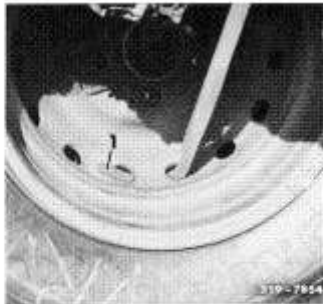
Verzurrriemen im Scheibenrad